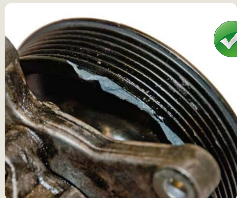
řemenice lehce poškozená