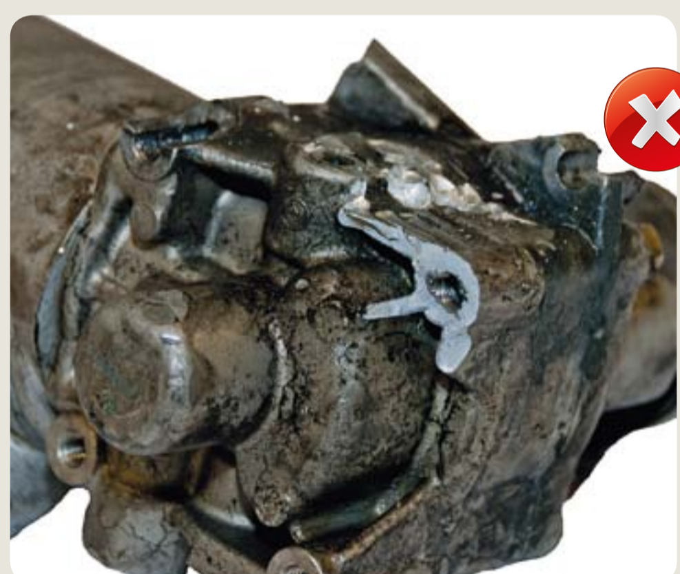
ulomený úchyt poškození vzniklá při manipulaci