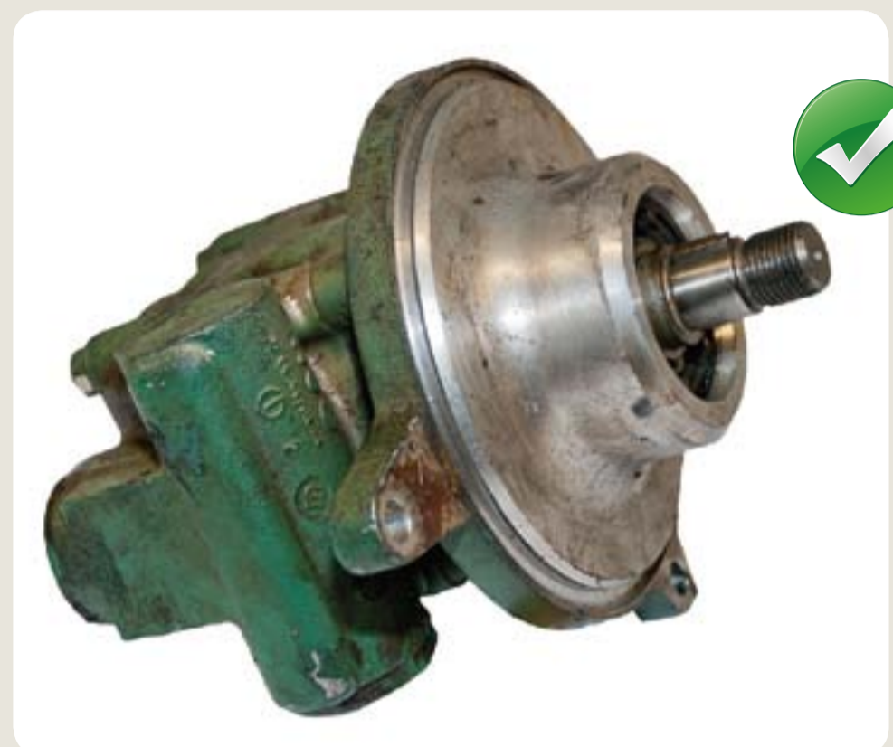
čerpadlo nepoškozeno málo rzi