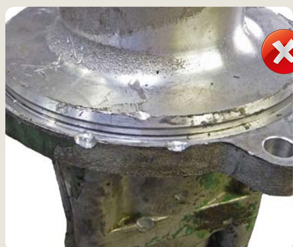
poškozené těleso poškození vzniklá při demontáži