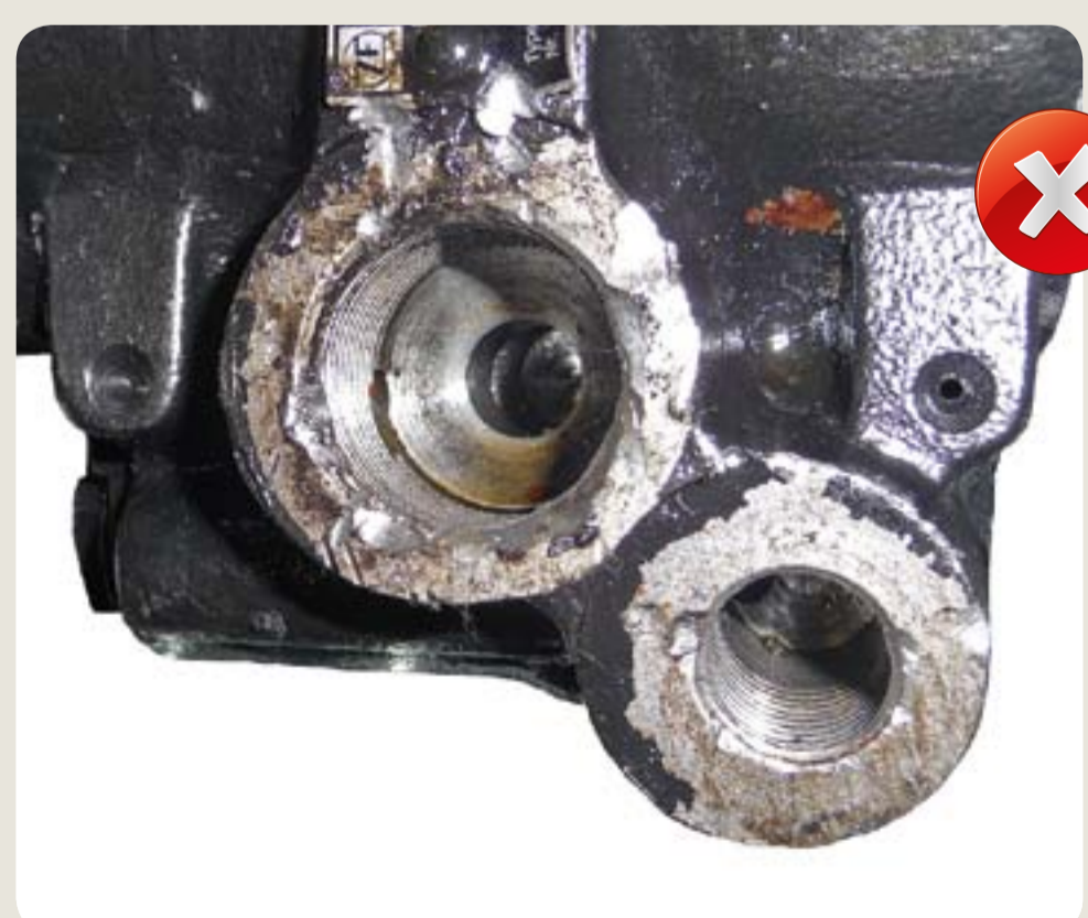
poškozený závit poškození vzniklá při demontáži